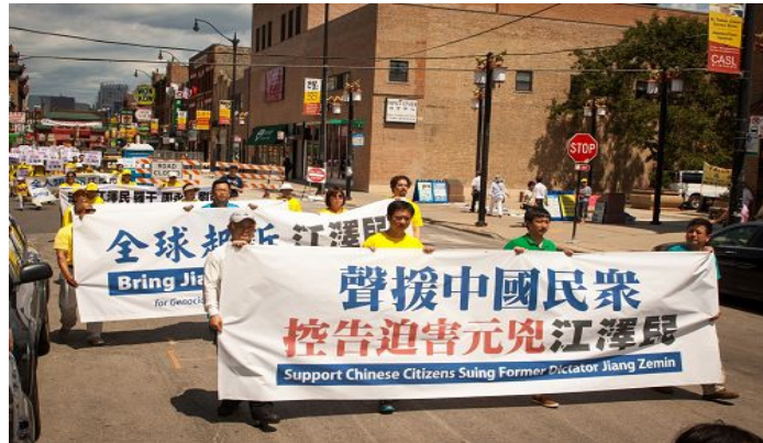
图：法轮功学员在芝加哥中国城游行，声援诉江潮

走在游行最前面的法轮功学员身着亮丽的炼功服,打着整齐响亮的腰鼓,随后是“法轮大法好”、“世界需要真善忍”等横幅,身着白衣的女士们手捧被中共迫害致死的学员遗像,呼唤人们的正义良知,