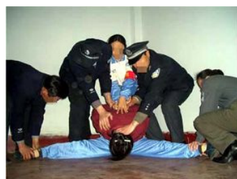
■ 酷刑图：1：铁椅子；2：用开口器强行灌食；3：双腿一字劈开