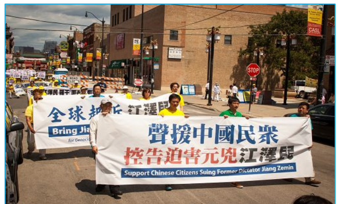
图: 法轮功学员在芝加哥中国城游行, 声援诉江潮

八月一日,来自美国中部十一个州的部分法轮功学员,在芝加哥中国城举行游行,声援目前中国大陆法轮功学员对江泽民罪行的控告。来美三个月的许大姐说:“每次我看到法轮功的活动,就会落泪。”她说:“我很爱看书,看过很多二战时期的书籍,那时的纳粹罪恶都赶不上今天共产党对他们(法轮功学员)犯下的罪!”