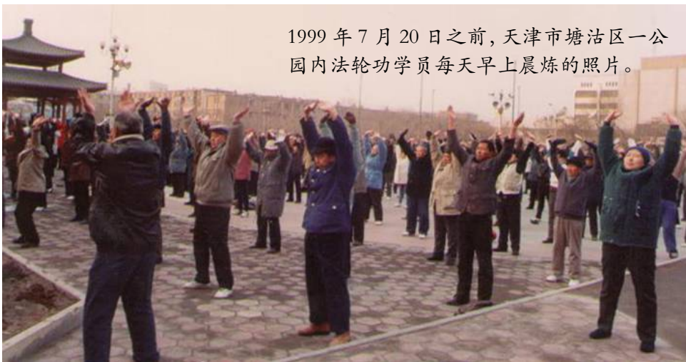
1999 年 7 月 20 日之前，天津市塘沽区一公园内法轮功学员每天早上晨炼的照片。

在院子里大喊：“我满礼堂找罗锅也没找到，原来您自己早回家了……啊！您的腰怎么直了？！”