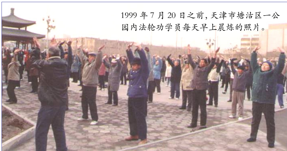
1999 年 7 月 20 日之前，天津市塘沽区一公园内法轮功学员每天早上晨炼的照片。

在院子里大喊：“我满礼堂找罗锅也没找到，原来您自己早回家了……啊！您的腰怎么直了？！”