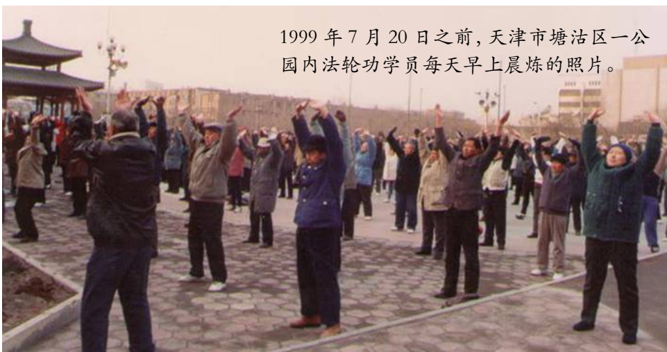
1999年7月20日之前，天津市塘沽区一公园内法轮功学员每天早上晨炼的照片。

在院子里大喊：“我满礼堂找罗锅也没找到，原来您自己早回家了……啊！您的腰怎么直了？！”