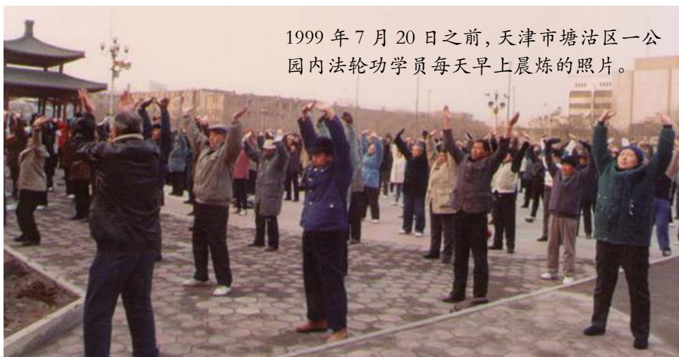
1999 年 7 月 20 日之前，天津市塘沽区一公园内法轮功学员每天早上晨炼的照片。

在院子里大喊：“我满礼堂找罗锅也没找到，原来您自己早回家了……啊！您的腰怎么直了？！”