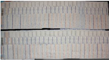
邮政特快专递回执单

愿所有善良的人们用良知分清正邪、明辨善恶!请与我们站在一起,共同把江泽民押上法庭,让江泽民接受人间法庭、道义法庭和人心法庭的正义审判,让正义、良知回归中原大地!”