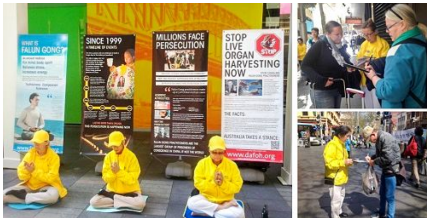
悉尼市民：都该了解真相

所谓“法制学校”，实际就是非法私设的“黑监狱”，强制改变人思想的洗脑班，对外自称所谓“法制学校”。我每天二十四小时被关押在几平米的小屋中，强制不让出房间达二十余天。仅此一点，可见所谓“法制学校”就是非法私设的“黑监狱”。“黑监狱”甚至更邪，因为监狱至少还有“兜风”的时间。◇