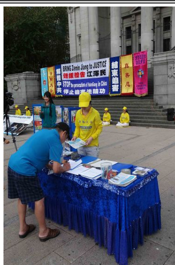
▲温哥华市民声援诉江