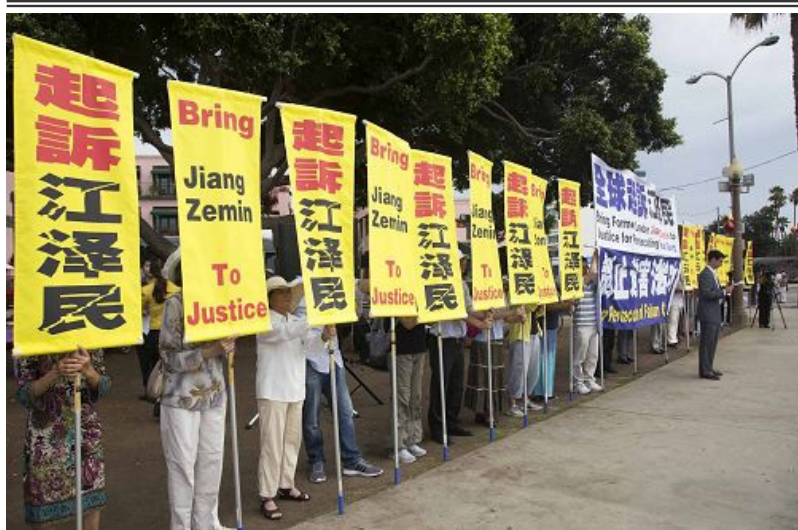
▲洛杉矶举办声援诉江集会