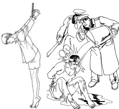
中共酷刑示意图：上绳吊铐；浇冰水

我曾患有心脏、肾炎、肾结石、胆囊炎、严重神经衰弱、胃病、长期失眠等综合疾病，每年报销医疗费 3