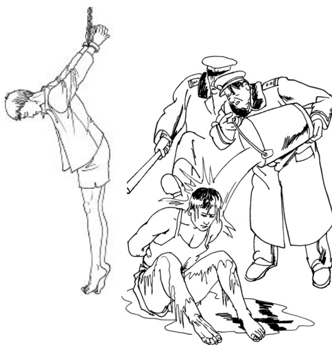
中共酷刑示意图：上绳吊铐；浇冰水

我曾患有心脏、肾炎、肾结石、胆囊炎、严重神经衰弱、胃病、长期失眠等综合疾病，每年报销医疗费 3