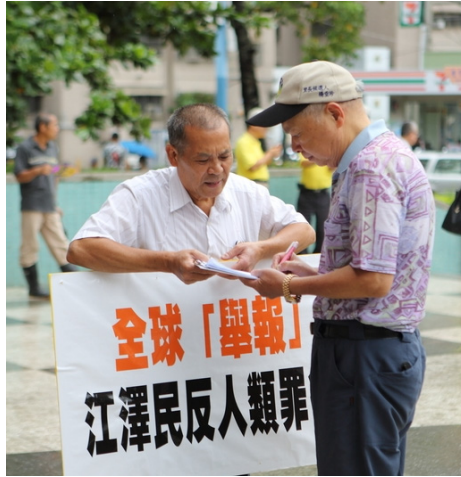
台湾民众声援中国民众控告江泽民

从五月底到八月二十七日，明慧网已收到总数 166,579 名（139,774 案例）法轮功学员及家属递交给中国最高检察院、法院、公安部等相关部门的诉讼状副本。八月二十一日至二十七日一周内，法轮功学员们突破封锁，通过邮寄、向官方网络电子投递等方式，邮寄出去或网上递达超过 8,728 人（7,714 案例）的诉江状。由于网络封锁和信息传输的不便，实