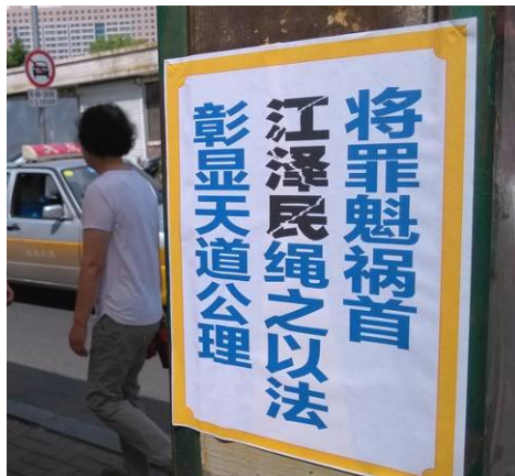
在中国大陆大街小巷可以看到的诉江真相标语。

早日变现。不难想象，各种“生长素”、“激素”、“催熟剂”大行其道；各种“概念”层出不穷，目的是好去炒炒火，捞一笔走人。这快速生长的奥妙，很多是不能说的、要“闷声”的，因为它那里头尽是缺德损人的东西。不择手段成了潜规则，人人理解，人人接受。