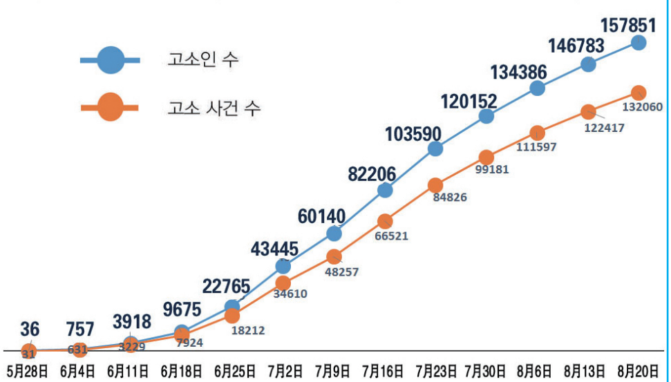
장쩌민 고소 사례 총 숫자와 고소인 총 숫자의 시간별 증가표

나는 그녀에게 중국 헌법과 국제법을 위반하면서 개인의 독단전행으로 오늘까지 16년 동안 파룬궁을 박해한 장쩌민의 범죄행위를 내가 고소한다고 알려주었다. 그리고 장쩌민 일당이 ‘천안문 분신자살’ 자작극을 만들어 사람들이 파룬궁을 증오하도록 선동했고, 현재까지 이미 3천 명이 넘는 파룬궁 수련생을 박해로 살해했고, 수십만 명을 부당하게 감옥에 가둬고, 심지어 살아 있는 파룬궁 수련생의 몸에서 장기를 적출해 폭리를 취했다는 등의 사실을 알려주었다. 또 장쩌민이 탐오와 부패로 나라를 다스려 관리들을 모두 부패시킨 것과 보시라이, 쉬 차이허우, 저우융강 등등 장쩌민을 따라 파