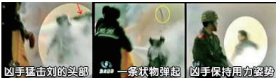
살인자가 머리를 강타

나중에 그들을 문 밖까지 배웅하면서 소선대 탈퇴를 권하자 내 말이 끝나기도 전에 한 사람이 “저는 탈퇴하겠습니다.”라고 말했고, 다른 한 명도 “탈퇴하겠습니다.”라고 말했다. 내가 가명으로 탈퇴하도록 도와주니 두 사람은 모두 아주 좋아했다. 한 명은 큰 소리로 말했다. “아주머니 감사합니다.”