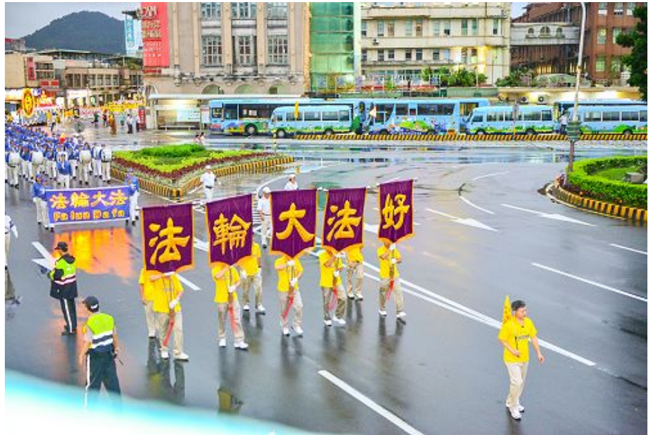
图：法轮功学员参加二零一五年台湾基隆市中元祭游行。

二零零八年的游行中, 下起了大雨, 其他的游行队伍纷纷躲雨, 场面变得零零落落的, 然而数百人的法轮大法队伍, 齐刷刷地在雨中展示功法, 优美的功法乐音与庄严的场面, 让现场民众难忘那一幕, 心中也铭记法轮大法好! 真善忍好! 那一年, 法轮大法队伍获基隆市政府颁发的最佳团体精神奖与优等奖。二零零九年到二零一二年, 还有二零一四年, 法轮大法队伍都获得最佳团体精神奖、甲等奖。二零一三年, 法轮功学员没参加游行, 许多民众遇到学员, 一直