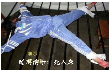
演示 酷刑演示：死人床

妈妈和姥姥对大法始终坚定，但由于失去了正常的修炼和生活环境，在各种压力和折磨中，妈妈身体每况愈下。二零零七年六月，妈妈和姥姥