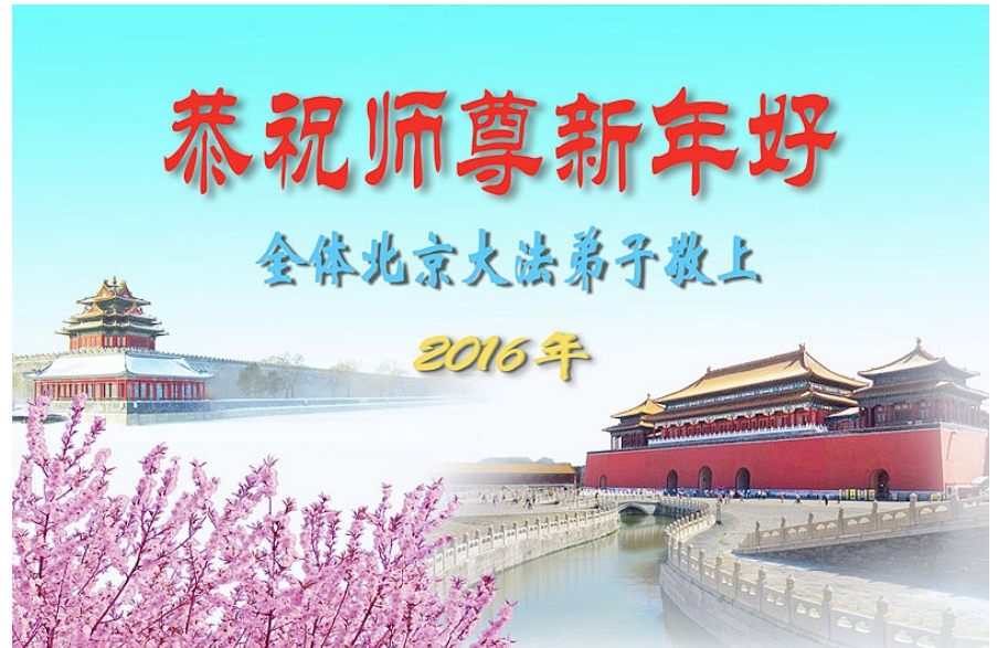
全体北京法轮功学员恭祝李洪志大师新年好！

山东省日照市一位老人对法轮功学员千叮万嘱，一定要代她向慈悲伟大的李老师表达谢意，感谢李老师的救命之恩！携全家向李老师叩首！祝李老师新年快乐！◇