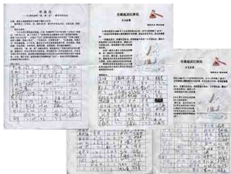
图：大陆民众声援起诉江泽民签名法轮功的人。”

江苏一位李先生是个退役军人，他说：“在部队里当官的人人都想走后门升官发财，唯有我的一位领导是炼法轮功的，处处事事为别人着想。可中共有眼无珠，受江泽民的操控在迫害这样的好人，我的老领导被绑架洗脑班迫害，并且还冤判他蹲几年的冤狱。我不但声援法轮功起诉江泽民，我还要准备控诉江泽民腐败治国。在这个世界上我最相信的就是炼