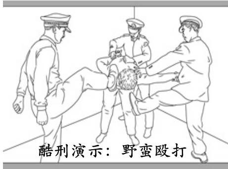
酷刑演示：野蛮殴打