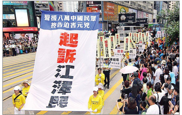
图: 2015 年 7 月 18 日, 法轮功学员在香港举行反迫害、声援“诉江”大游行, 吸引众多民众观看。

听到法轮功学员起诉江泽民的消息, 中国大陆民众振奋不已, 许多民众都在等着审判恶首江泽民的那