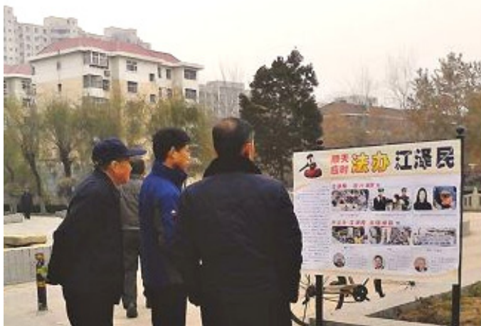
大陆民众观看“法办江泽民”展板（摄于河北石家庄）

◎二零一六年新年伊始，在中国河北、黑龙江、辽宁、山东等地，都出现了“法办江泽民”的展板，告知人们江泽民迫害法轮功的罪行及各国民众和政要对于超过二十万中国大陆法轮功学员实名控告江泽民之事的支持。（图）