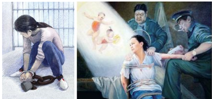
中共酷刑图示：锁地环、强制注射不明药物

我所在的 124 监室，有在押人员被关小拘，受惩罚（使用酷刑）情况，一个黑龙江佳木斯女孩因与同室人员吵架被戴刑具手铐脚镣，看管民警没有采用沟通教育感化的方式化解该在押人员之间的矛盾，导致其情绪不稳再次与其他人发生矛盾，看守所所长继续使用酷刑（双手双脚伸开呈“大”字形躺在地上，四肢锚上铁链，除上厕所外，无法改变姿势），还要全监室在押人员连坐，每天派二个人照管，二十四小时换休。