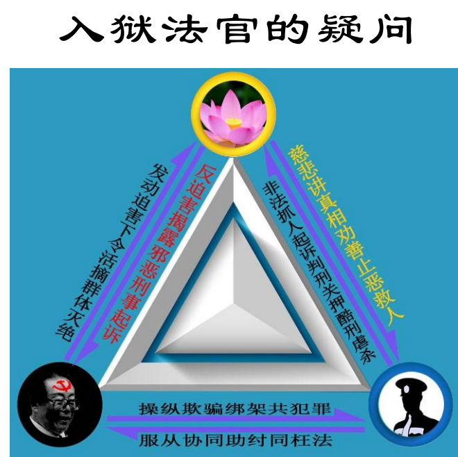
图：迫害与反迫害关系示意图

我说：“概括的说就是善恶有报，这是天理的表现，是任何人都逃不过的宇宙规律，这个理，我们炎黄子孙传