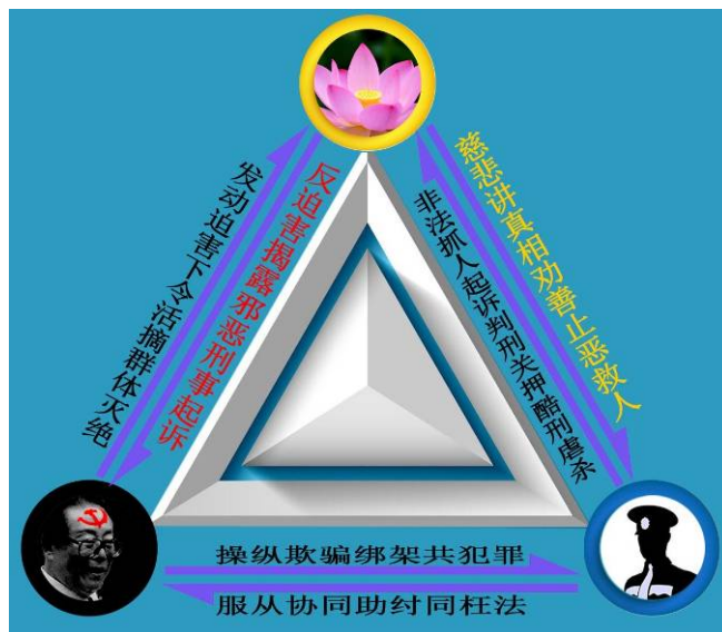
图：迫害与反迫害关系示意图

了几千年了，可是到了中共这不认这个理了。但是天理是无法被否认的。大量的事实就摆在面前。人做了善事、积了德就有福报；做了坏事、造了业就遭恶报。作为法官，如果能对杀人犯、投毒放火犯、拐卖妇女