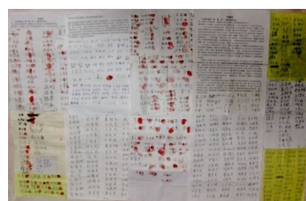
图：山东招远部分居民签名举报江泽民迫害法轮功

动用宣传机器，编造了震惊全球的‘天安门广场自焚伪案’诬蔑法轮功。江泽民幕后指挥活摘法轮功学员器官牟取暴利。2014 年 9 月，一中共高官直接证实江泽民参与其中。根据一个电话录音，当被问到活摘法轮功学员器官的命令是从哪儿来的，原解放军总后勤部卫生部部长白书忠回答说：‘当时是江主席啊……有一个批示，说开展这些事情，就是器官移植……’”