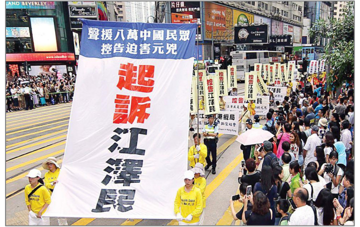
图: 2015 年 7 月 18 日, 法轮功学员在香港举行反迫害、声援“诉江”大游行, 吸引众多民众观看。