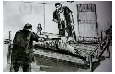
中共酷刑示意图：绑床并电击

绥化劳教所是全国迫害法轮功最严重的地方之一。我仍然不穿狱衣。几天后的一天早晨，其他犯人都出工后，大队指导员和一个狱警把我带到楼上，把我的两个大脚趾用电线栓上，电线另一端拴在电棍上，把我呈大字型铐在两侧床上，指导员拿着电棍，我不“转化”，他就开始电我。每次给电，只见我的两腿就被电得腾空起来了，腿上剧烈的疼痛，一直这样折磨到下午，直到我被折磨得出现