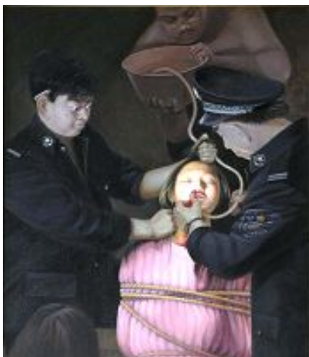
酷刑演示：破坏性灌食

吉林省女子监狱的第八监区是专门关押法轮功学员的地方，死亡在这里不是什么新鲜事。据明慧网报导，从 2002 年以来，这里关押了六百多名来自全省各地的法轮功修炼者，其中刑期最长的十九年，最短的