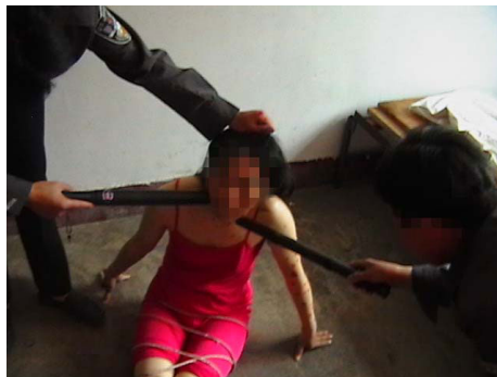
中共酷刑演示图:电棍电击