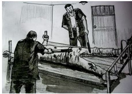
中共酷刑示意图：长期绑床并电击

2001年大学毕业刚刚办理离校，我被有预谋的警察抓进学校附近的和平北路派出所。在这个派出所我被毒打酷刑折磨二十一天，全身被毒