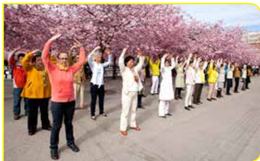
瑞典法轮功学员的炼功场景