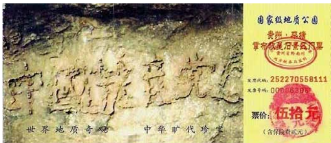
2002 年 6 月在贵州发现的“藏字石”断面上显现“中國共產党亡”六个大字，昭示着“天灭中共”的天意。图为贵州省平塘县掌布乡风景区门票。

您可能会说“我年岁大了早就超龄自动退了”，或者是“我不交党费了，不算是党员了”，这些都不是上天认可的，人要有行为上的表示才算数，用真名、化名、小名退都可以。不是在组织内退，是在海外最大的华人媒体大纪元的退党网站上声明退出，没有任何风险，却可以在天灭中共时保命，老天看的是人心。◇