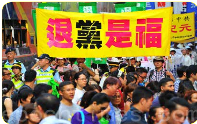
海外声援大陆退党大游行