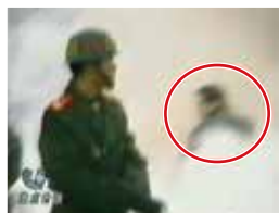
凶手刚刚用过力的姿势