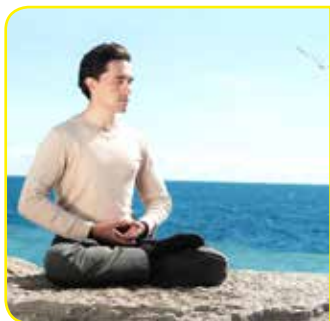
加拿大法轮功学员在炼功

● 法轮大法弘传世界 法轮功至今已弘传世界100多个国家和地区，法轮功的书籍被译成30多种语言出版发行，并可在法轮大法网站上 ( falundafa.org ) 免费下载。李洪志先生和法轮大法获得各国政府各类褒奖、支持决议案和信函超过3000项。“真、善、忍”的信仰得到了世界各族裔民众的爱戴和尊敬，却在大陆一地受到残酷迫害。◇