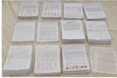
34804 人签名支持诉江泽民