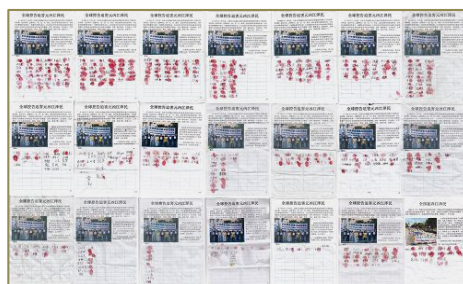
1160 名民众签名支持控告江泽民

一老人在签名表的背面写着：江泽民这个大魔头，真是坏透了，不仅迫害善良的好人，还活摘法轮功学员的器官，比法西斯还残忍。