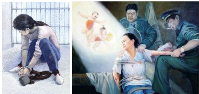
中共酷刑图示：锁地环、强制注射不明药物

据明慧网不完全统计，自一九九九年中共迫害法轮功后，至少一万两千名法轮功学员被非法判刑。其中，黑龙江省法轮功学员被非法判刑人数超过一千二百人。黑龙江女子监狱，十五年来非法关押法轮功学员达千人，是中国大陆非法关押法轮功学员，并残酷迫害的监狱之一。目前该监狱仍关押着数百名法轮功学员。