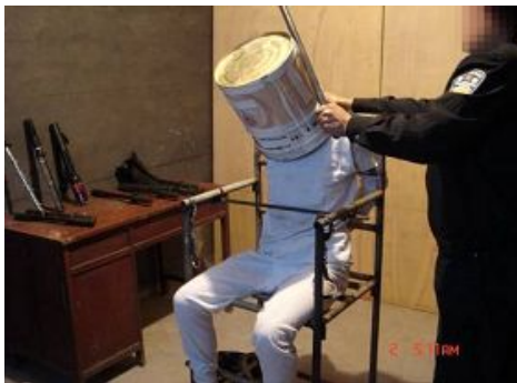
中共酷刑演示：铁桶敲头