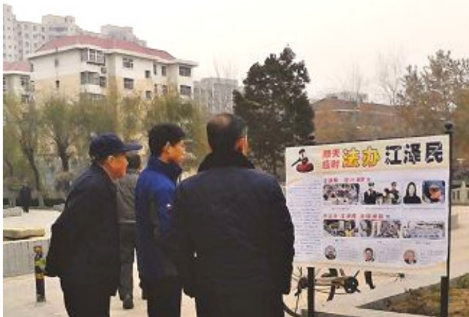
大陆民众观看“法办江泽民”展板（摄于河北石家庄）

◎二零一六年新年伊始，在中国河北、黑龙江、辽宁、山东等地，都出现了“法办江泽民”的展板，告知人们江泽民迫害法轮功的罪行及各国民众和政要对于超过二十万中国大陆法轮功学员实名控告江泽民之事的支持。（图）