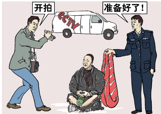
■ 江泽民集团制造“天安门自焚”伪案嫁祸法轮功。