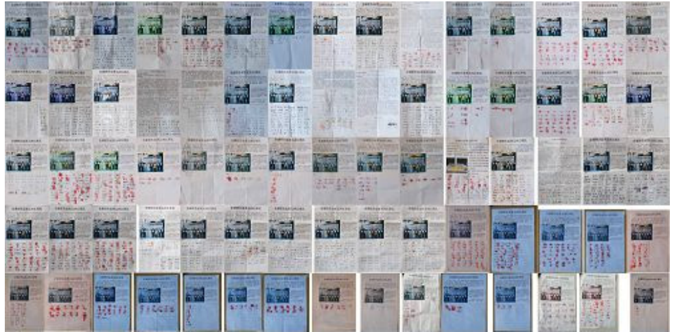
张家口郊区与周边县部分居民签名举报迫害法轮功的元凶江泽民

◆一天，几位法轮功学员到农村讲真相、劝三退。见到一位六十多岁的老大哥正在院子搓玉米。学员问他说：你认识字吗？送你一本书看看。说着递给他一本真相期刊，他当时放下手里的活就看起来，并将题目念出