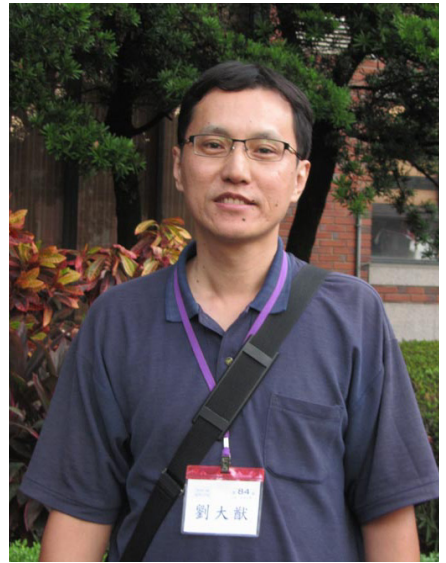
台湾刘大猷喜得法轮大法，找到人生方向，身心轻松自在。

法轮大法也称法轮功，是由李洪志先生于一九九二年五月传出的佛家上乘修炼大法，以宇宙最高特性“真善忍”为根本指导，同时包含五套缓慢优美的功法动作。法轮功至今已弘传世界100多个国家和地区，修者上亿。法轮功的书籍被译成30多种语言出版发行，并可在互联网上免费下载。下图为二零一六年五月十二日千名纽约法轮功学员以曼哈顿为背景排出“法轮大法”四个字。