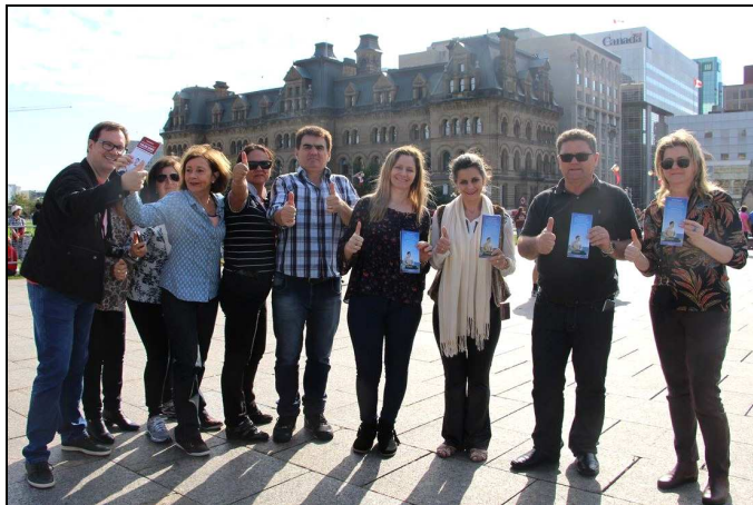
葡萄牙游客手持法轮功传单竖拇指表示支持 法轮功反迫害。

当天下午在总督府门前，法轮功学员也打出了要求停止迫害的横幅。一个陕西大同地区的旅游团来到这里观光，一下车看到这么多法轮功学员，不禁惊呼：哇，真是大开眼界！当他们了解到全球一百多个国家和地区都有人修炼法轮功，唯独中共在非法迫害，同时明白了三退的真正意义和重要性后，有些游客当场做了三退。