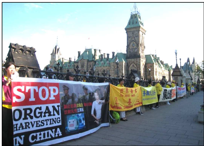
国会山前的法轮功学员与横幅。

9月21日一早，在威斯汀酒店对面，中国领馆组织的欢迎队伍和法轮功学员的队伍分列两侧。那些手拿着红旗的欢迎队伍成员，看着举止平和的法轮功学员及他们打出的横幅，很多人面带深思，有人跟法轮功学员聊起来了、表示以后找机会多沟通，有的现场做了三退（退出中共党、团、队组织），还有的表示要开始炼法轮功。