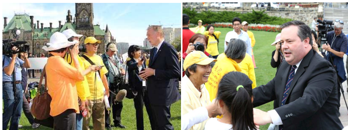
(左)国会议员 国会法轮功之友主席肯特、(右)国会议员康尼，来到集会现场向法轮功学员致意。

议的国会议员来到集会现场，跟法轮功学员热情握手、打招呼，表达支持之意。国会议员、加拿大国会法轮功之友主席肯特表示，希望李克强能把法轮功学员的信息带回中国，敦促中国政府起诉江泽民，将其绳之以法。资深国会议员康尼到场声援，他连续三次用中文高呼：法轮大法好！真善忍好！