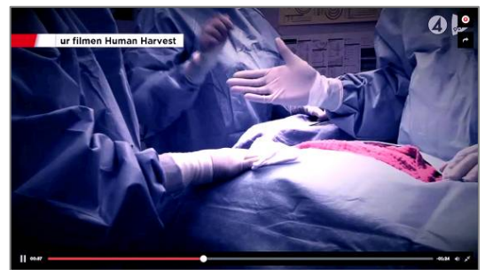
▲ 瑞典电视四台 (TV4) 关于中共强摘器官问题的报道