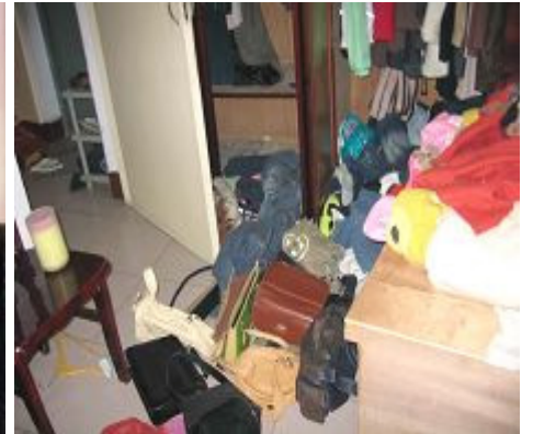
被抄家后满目狼藉