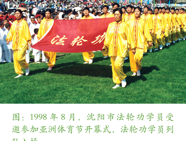
图：1998 年 8 月，沈阳市法轮功学员受邀参加亚洲体育节开幕式，法轮功学员列队入场。

这位篮坛宿将就像凌风傲霜的菊花，在苦寒中保持着高洁与坚韧，守护着她心中无悔的信仰！◇