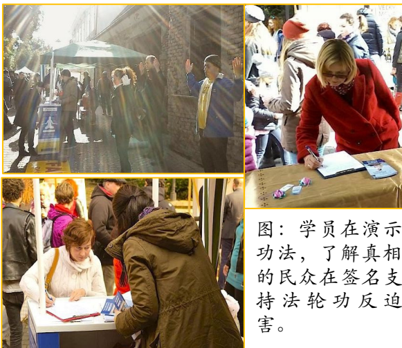
图：学员在演示功法，了解真相的民众在签名支持法轮功反迫害。