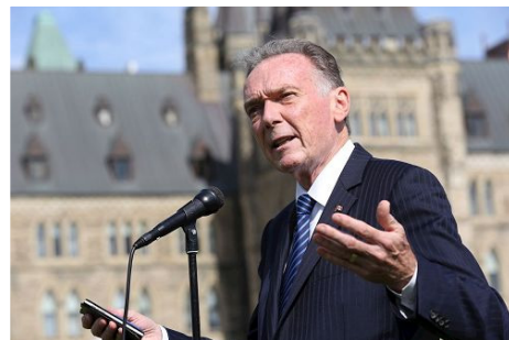
▲国会议员 Peter Kent 于九月二十二日现场支持法轮功，并在发言中敦促中国领导人法办江泽民。

和向中国民众讲法轮功被中共迫害的真相，都遭受过肉体和精神折磨。他们二零零四年就在加拿大以反人类罪控告了江泽民。