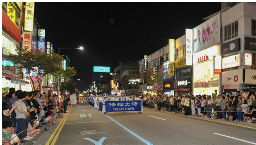
한국 천국악단의 성대한 공연이 시민들의 환영을 받다.

천국악단이 '파룬따파는 좋습니다' 연주를 시작하자 온 장내는 갑자기 조용해졌고 사람들은 조용히 음악을 들었다. '파룬따파는 좋습니다'가 끝나자 관객들은 열렬한 박수갈채를 보냈다. '불은 성악(佛恩聖樂)'을 연주할 때부터 장내 관중들은