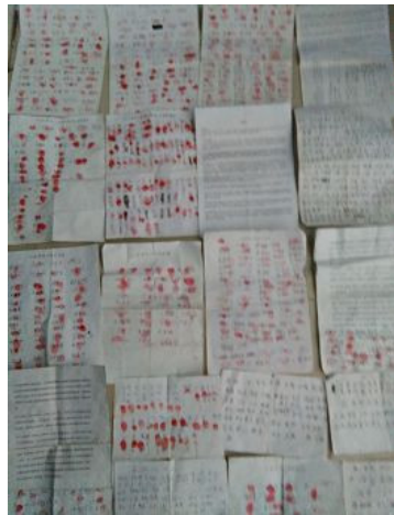
石家庄市平山县又有 856 位民众联名举报江泽民

《河北省平山县来稿》自最高法院二零一五年五月一日起实行“有案必立，有诉必理”之规定后，河北省石家庄市平山县法轮功学员纷纷将控告迫害元凶江泽民的诉讼状通过各种方式邮寄到北京最高检察院、最高法院，要求对江泽民立案调查，追究其刑事责任，还法轮大法公道，还