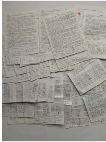
石家庄市井陘县一千一百多位民众联名举报元凶江泽民