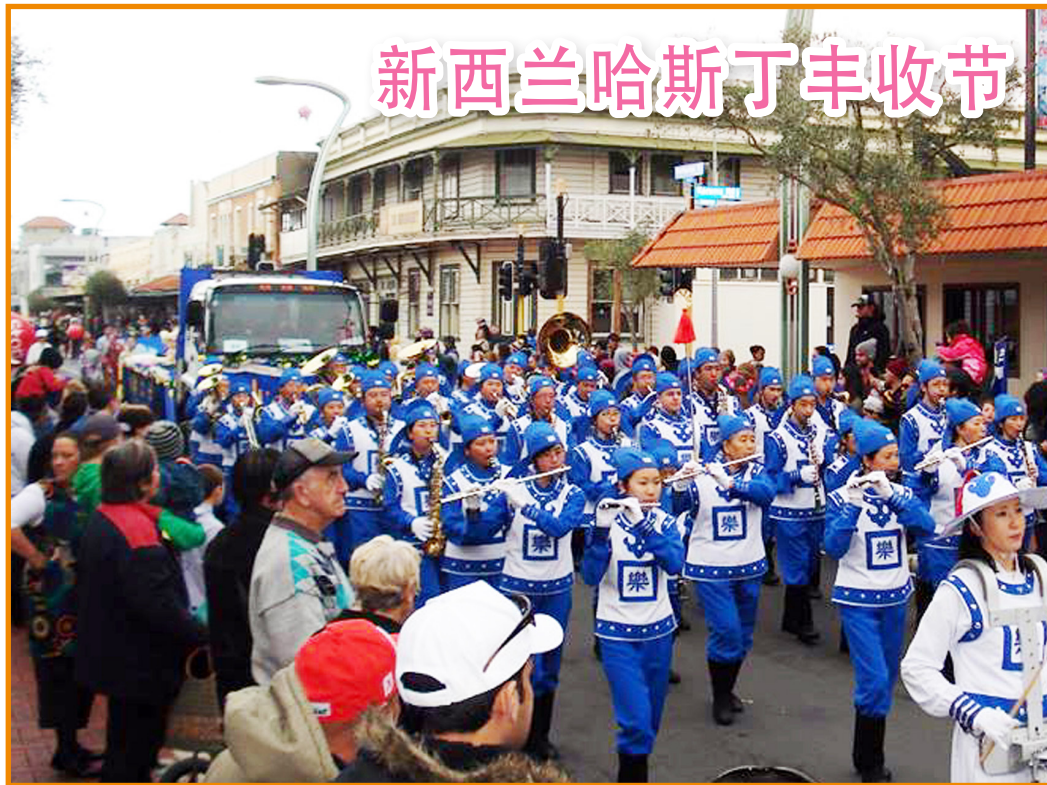
新西兰哈斯丁丰收节

位于新西兰北岛的哈斯丁市(Hasting)是一个美丽安宁的小城市。每年，这里的人们都举行丰收节的庆祝活动。丰收节游行始于1950年，为的是庆祝春天的到来，给人们带来了繁荣和收获。由法轮功学员组成的天国乐团多次应邀参加游行。