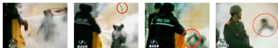
凶手猛击刘的头部