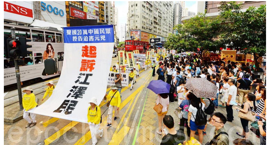
香港法轮功学员在北角举行反迫害 17 周年集会游行，途中经过闹市区到中联办，呼吁“解体中共、结束迫害、法办江泽民”。

现在，越来越多的民众踊跃“三退”（退党、退团、退队）保平安，也愿意举报江泽民。许多地方的人形成了口头禅：退党、团、队是保平安！举报江泽民是得大福报！