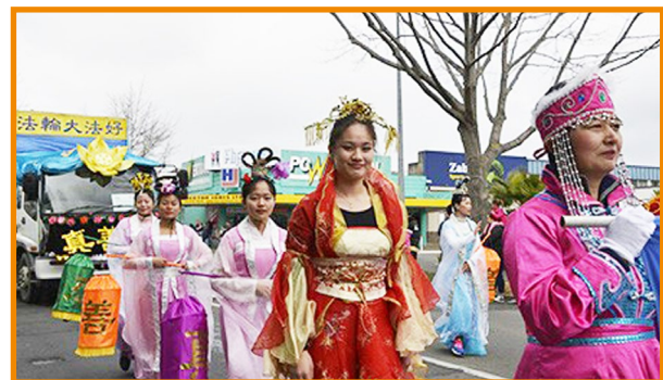
哈斯丁丰收节大游行。