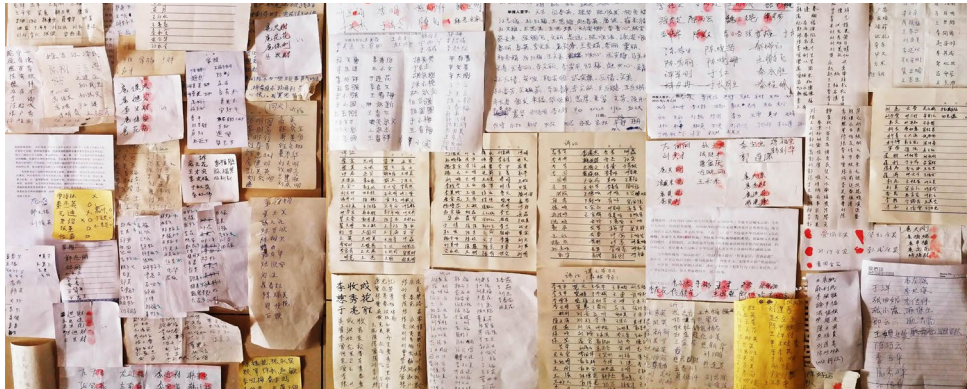
潍坊市部分市民签名举报迫害元凶江泽民

从 2015 年 11 月开始到 2016 年 6 月，仅潍坊下属的两个乡镇就有 7000 人签名举报迫害法轮功的首恶江泽民。这仅是局部统计，更多的举报人数在目前迫害的形势下尚无法统计。