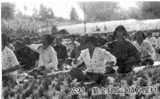
农村 紫金县临江镇卢屋村

1998年初，法轮大法传到了这个小村庄。全村300人，有80多人每天参加集体读法轮功书籍、炼功，自觉地不再干偷盗的事了。在这些人的带动下，这里的“偷盗风”得到了彻底的改变。这一年的冬天，村民们派代表，到广州参加法轮功的修炼心得交流会，谈了他们变化的经过。