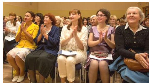
■ 与会的法轮功学员晨炼。右图：俄罗斯法轮大法修炼心得交流会现场。

【明慧网】二零一六年九月二十四日~二十五日，第十七届俄罗斯法轮大法修炼心得交流会在莫斯科召开。来自不同地区的法轮功学员分享了按照“真善忍”的原则修炼、获得身心健康等方面的体会。