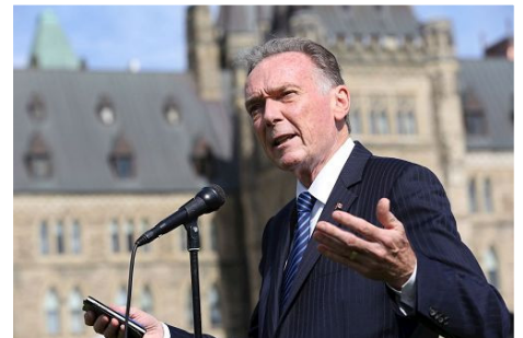
▲国会议员 Peter Kent 于九月二十二日现场支持法轮功，并在发言中敦促中国领导人法办江泽民。

和向中国民众讲法轮功被中共迫害的真相，都遭受过肉体和精神折磨。他们二零零四年就在加拿大以反人类罪控告了江泽民。