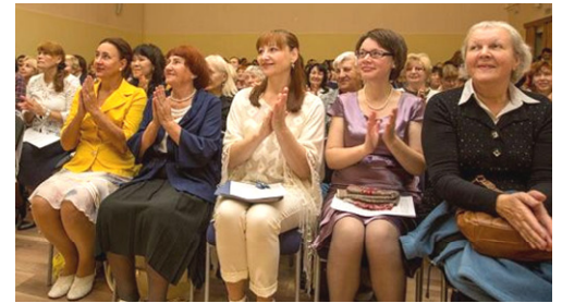
■与会的法轮功学员晨炼。右图：俄罗斯法轮大法修炼心得交流会现场。

【明慧网】二零一六年九月二十四日~二十五日，第十七届俄罗斯法轮大法修炼心得交流会在莫斯科召开。来自不同地区的法轮功学员分享了按照“真善忍”的原则修炼、获得身心健康等方面的体会。