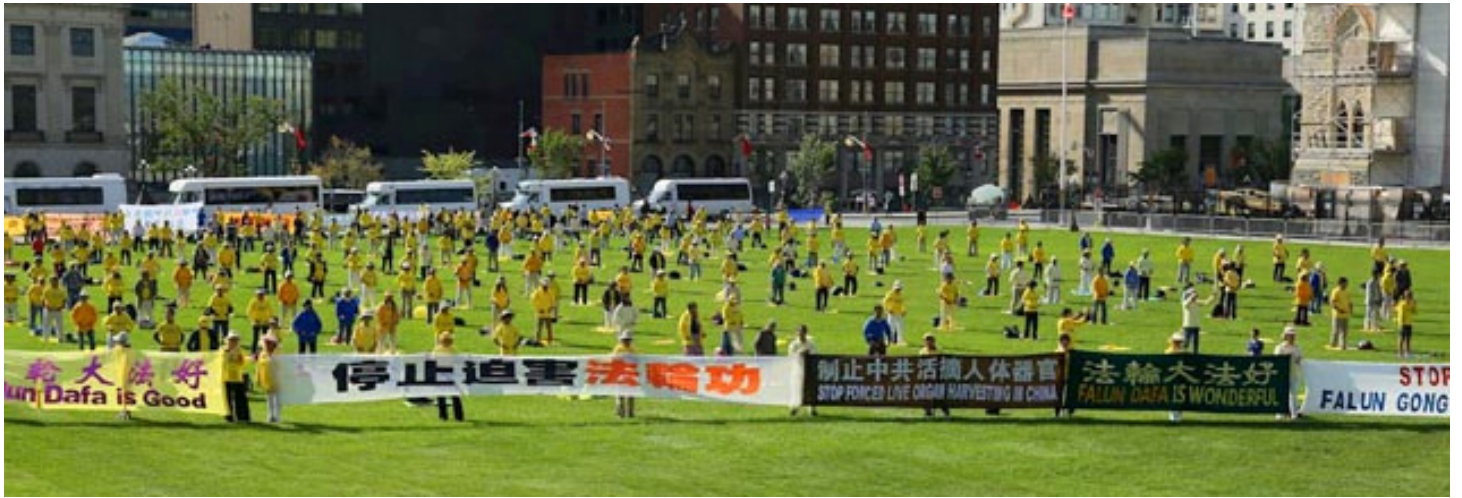
▲法轮功学员在加拿大国会山前炼功，并打出横幅，呼吁停止迫害。