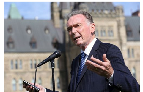
▲国会议员 Peter Kent 于九月二十二日现场支持法轮功，并在发言中敦促中国领导人法办江泽民。

和向中国民众讲法轮功被中共迫害的真相，都遭受过肉体和精神折磨。他们二零零四年就在加拿大以反人类罪控告了江泽民。